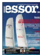
Essor Janvier 2010