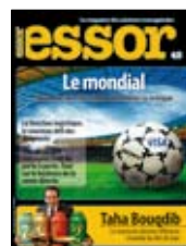
Essor Juillet-Août 2010