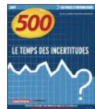
Les 500 Edition 2009