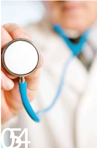
L'AMO, cinq ans après...