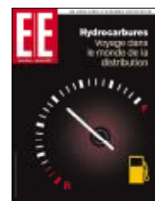
Hors-série EIE Jan- Fév 2010